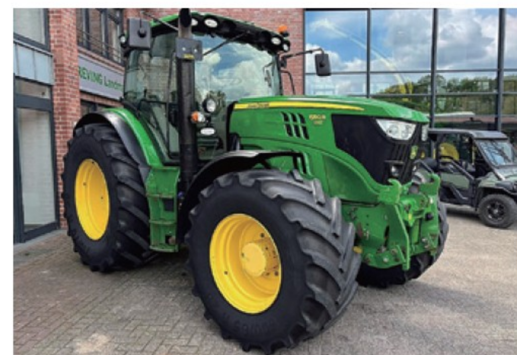
JD 6150R ■150馬力 ■2014年 ■CVT ■9,705時間 ¥15,840,000