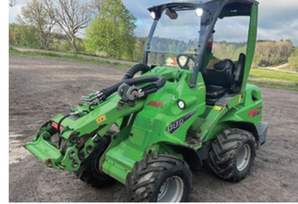
アバント 640L ■38馬力 ■揚力 1,100kg ■2026年 ■50時間 ¥10,560,000