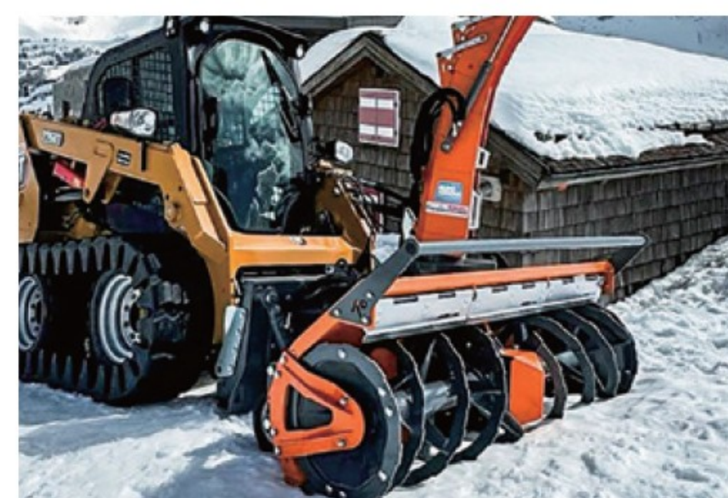
アノビ 除雪ブロワー ■1.2-2.4m ■アバント/スキッド用 新車 都度見積