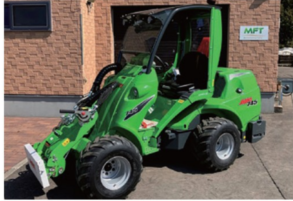
アバント 745L ■49馬力 ■揚力 1,400kg ■2025年 ■50時間 ¥9,240,000