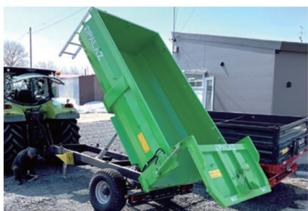
パラツ CARGO 5T ■5,200L ■油圧ブレーキ 新車 ¥2,420,000