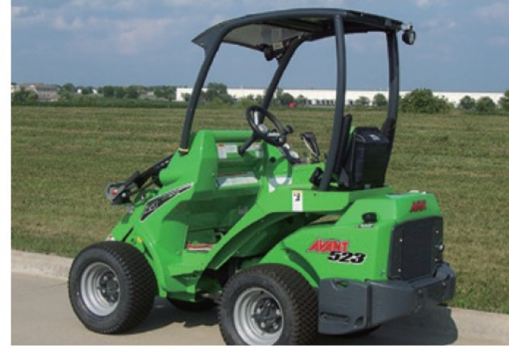
アバント 523L ■22馬力 ■揚力 800kg ■2026年 ■50時間 ¥7,590,000