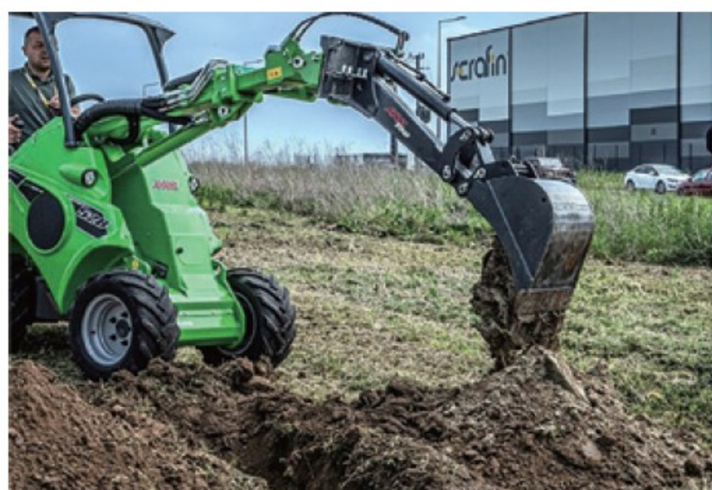
アバント用 ミニディガー ■深度 1.8m ■165kg デモ機 ¥825,000