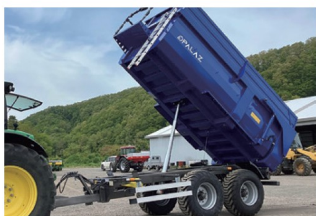
パラツ CARGO 12T ■15,000L ■油圧ブレーキ デモ機 ¥4,290,000