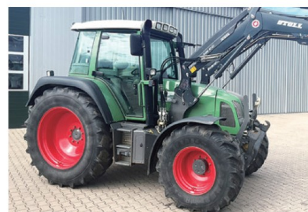
フェント 412 ■120馬力 ■2002年 ■ローダー ■5,990時間 ¥15,400,000