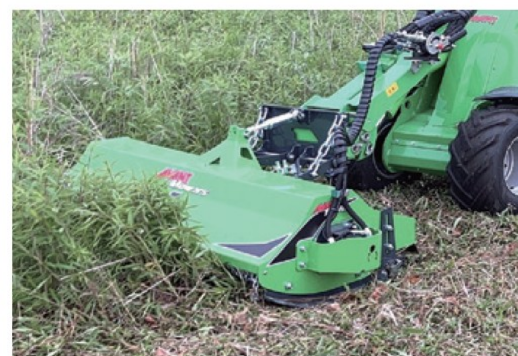
アバント用 フレールモア ■1.5m ■ハンマー ■270kg デモ機 ¥792,000