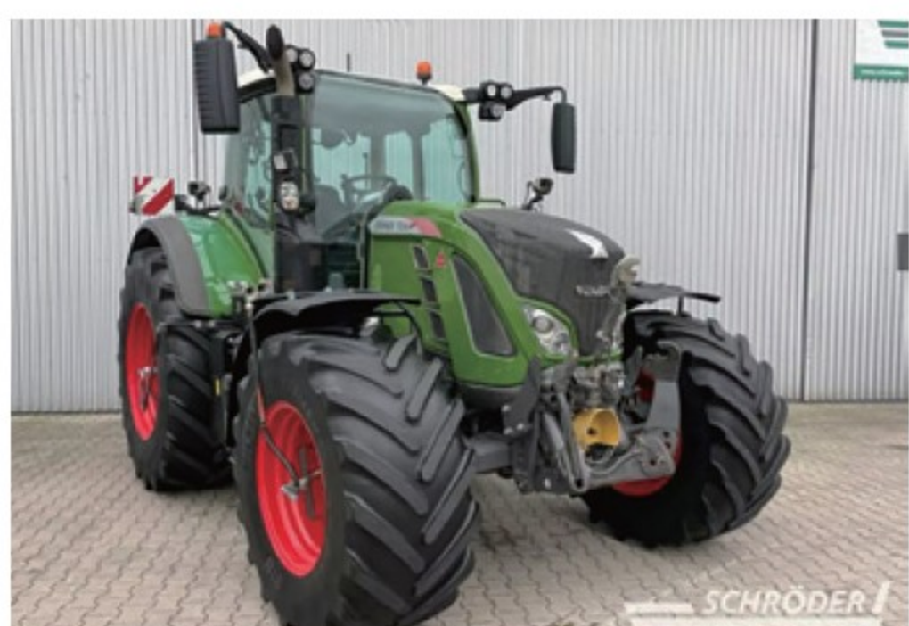
フェント 724 S4 Profi Plus ■240馬力 ■2016年 ■フロントPTO ■7,820時間 ¥22,000,000