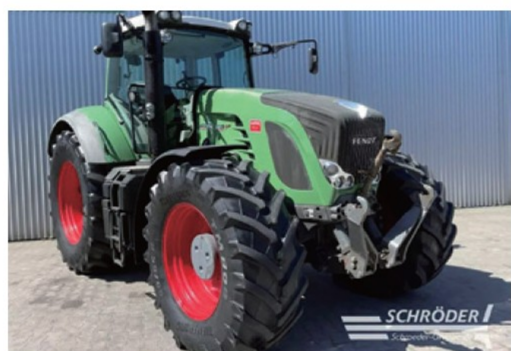
フェント 930 Profi ■300馬力 ■2011年 ■14,450時間 ¥16,390,000