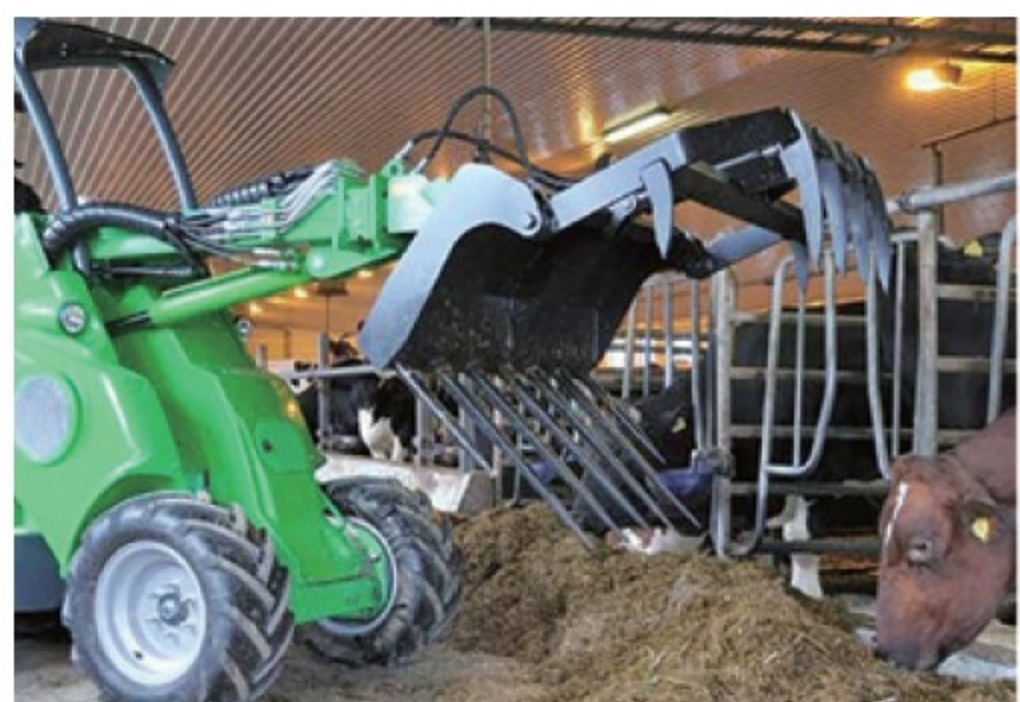
アバント用 サイレージフォーク ■1.3m ■160kg デモ機 ¥352,000