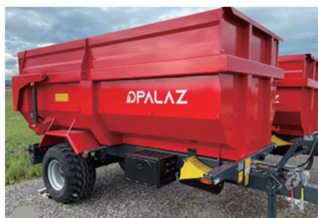
パラツ CARGO 8T ■9,700L ■油圧ブレーキ 新車 ¥2,970,000