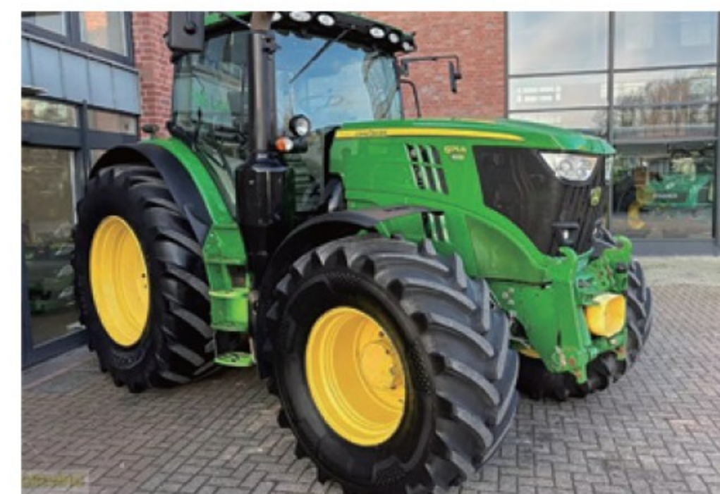
JD 6175R ■175馬力 ■2015年 ■CVT ■9,350時間 ¥16,390,000