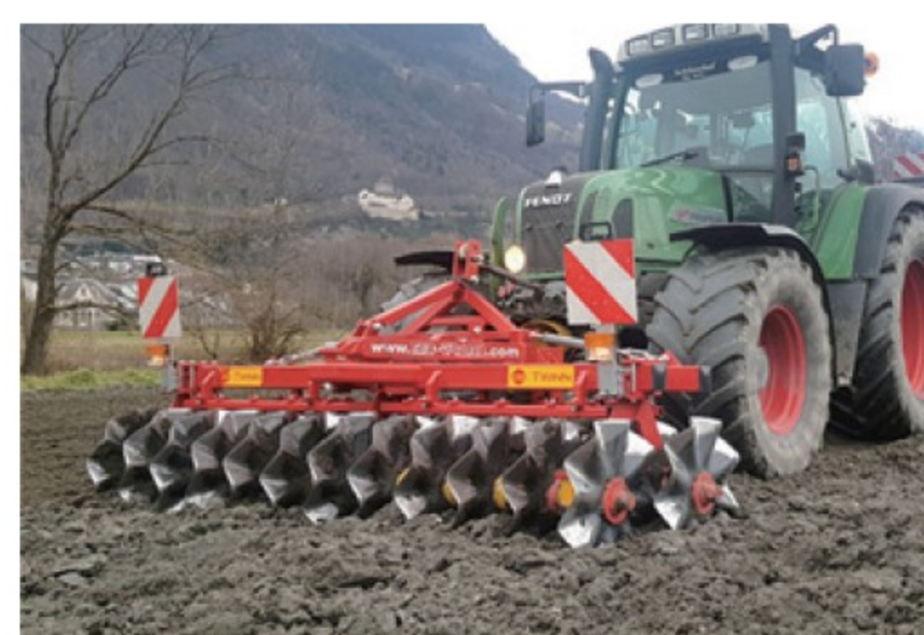
ブリックス フロントディスク ■2.5m-6m 新車 都度見積