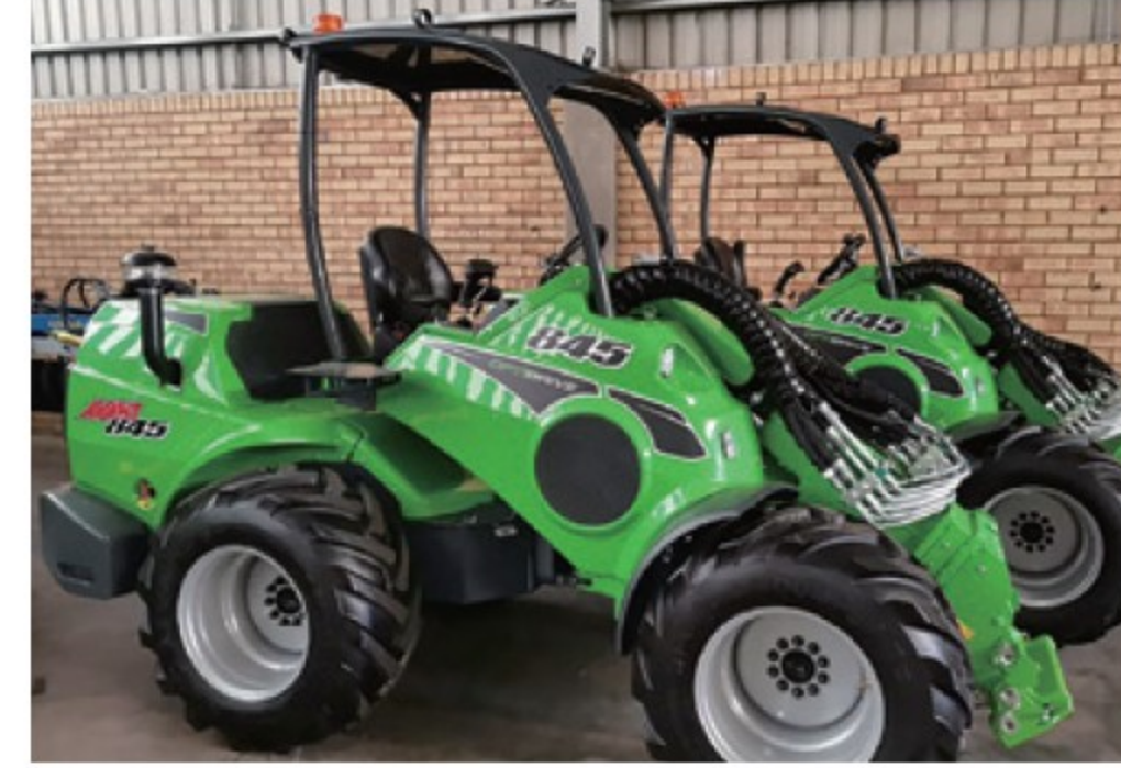
アバント 845L ■49馬力 ■揚力 1,900kg ■2026年 ■50時間 ¥11,110,000