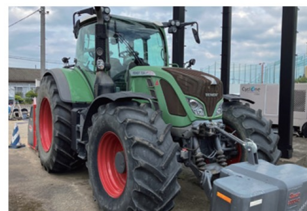
フェント 724 SCR Profi Plus ■240馬力 ■2013年 ■ウェイト付き ■6,700時間 ¥16,500,000