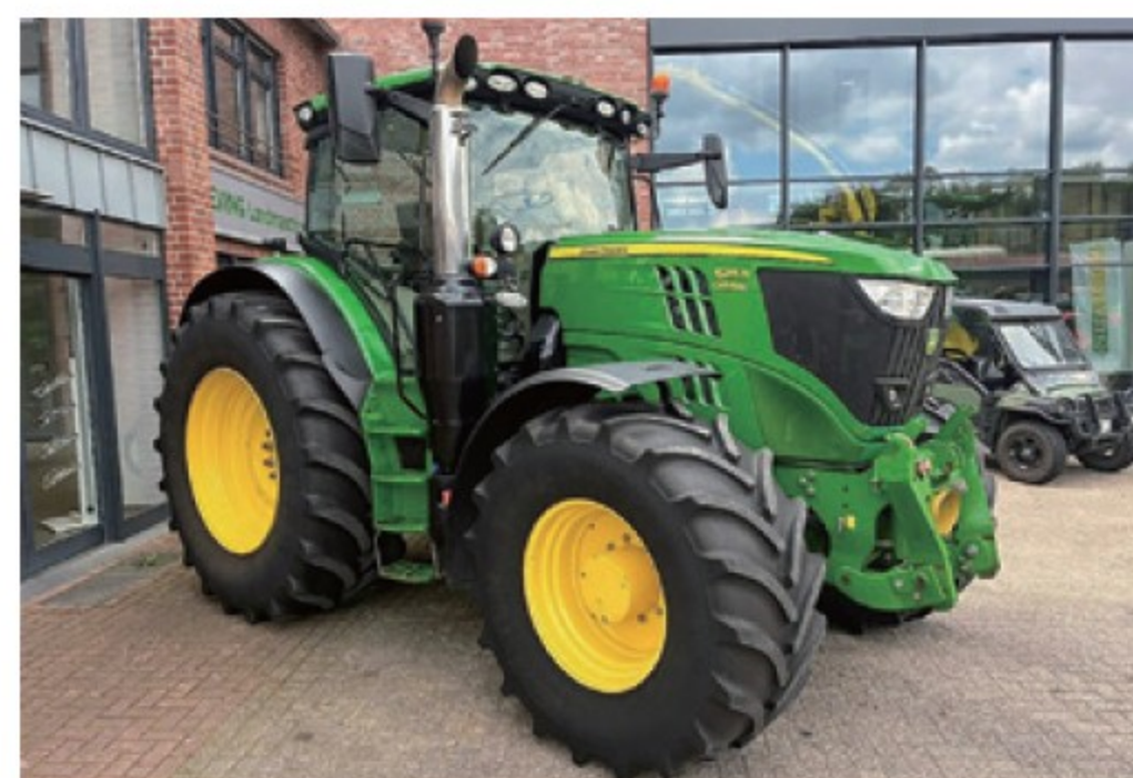
JD 6215R ■215馬力 ■2016年 ■CVT ■8,550時間 ¥18,810,000