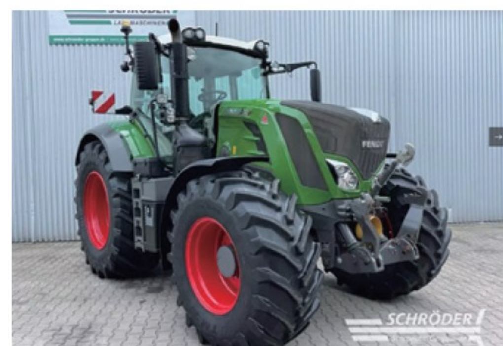
フェント 828 S4 Profi Plus ■280馬力 ■2018年 ■フロントPTO ■7,170時間 ¥21,890,000