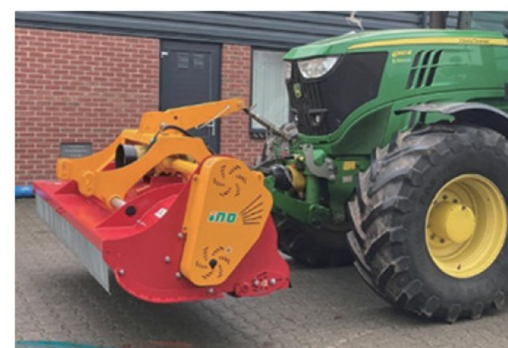
イノフレールモアドミネーター 280 ■2.77m ■ハンマー ■1,023kg 新車 ¥2,156,000