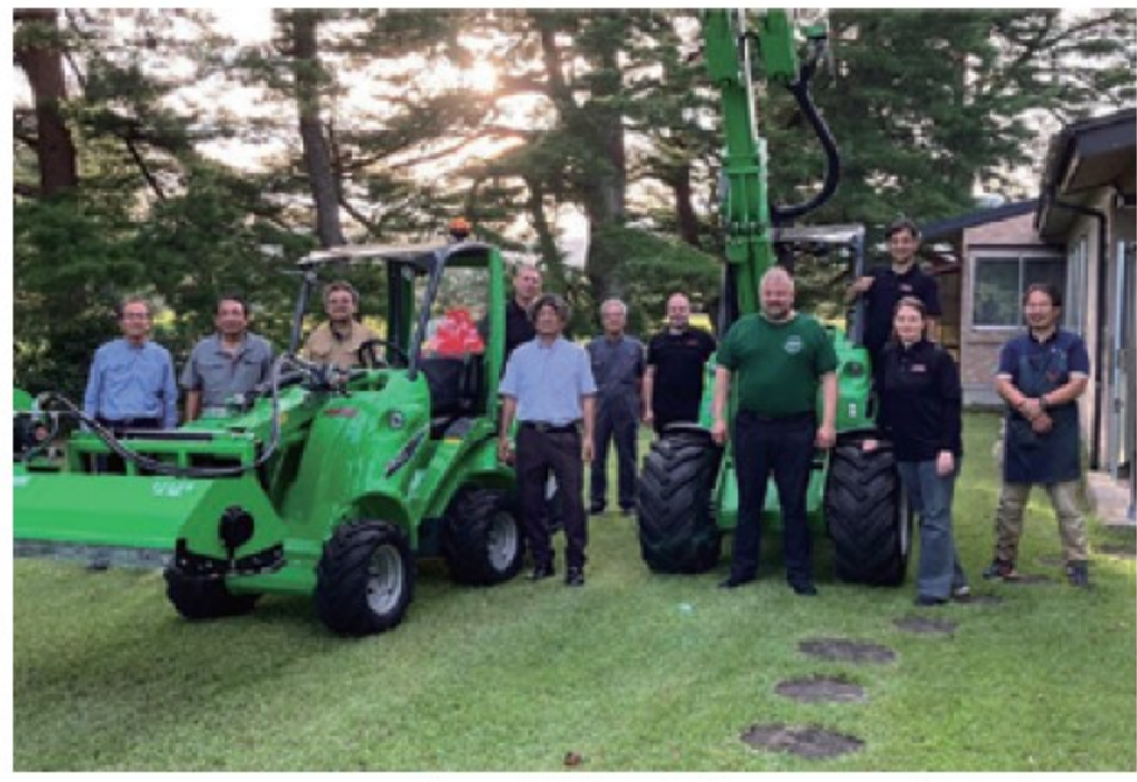
■ サービス講習会 in 岩手