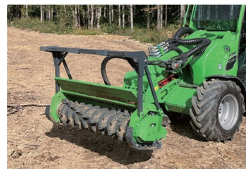
アバント用 林業マルチャー ■1.35m ■ブレード ■440kg デモ機 ¥2,728,000