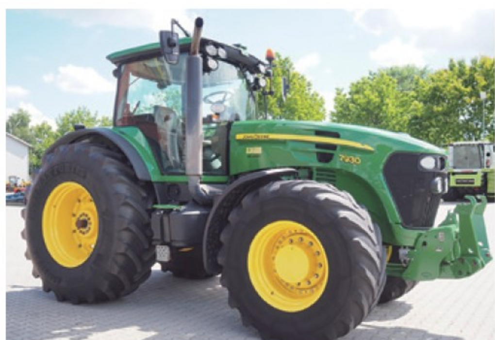
JD 7930 ■220馬力 ■2009年 ■12,350時間 ¥15,620,000