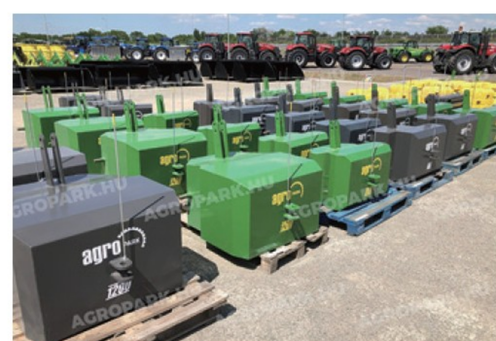
AP ウェイト ■600kg/800kg/1200kg 新品 ¥220,000~¥330,000