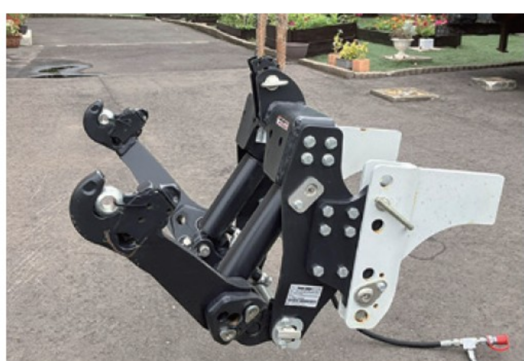
ハイドラック フロントリフト ■取付費用別 ■ホース別 新品 ¥660,000