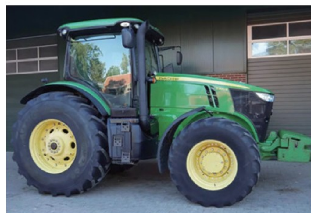
JD 7260R ■260馬力 ■2013年 ■CVT ■8,640時間 ¥14,190,000