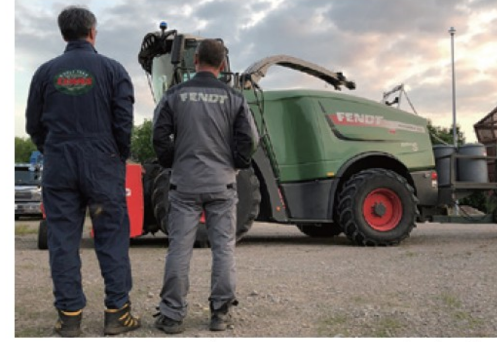
■ CCY スタッフ with カタナ