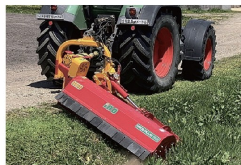
イノフレールモア MKS 190 ■1.92m ■ハンマー ■746kg 新車 ¥2,189,000