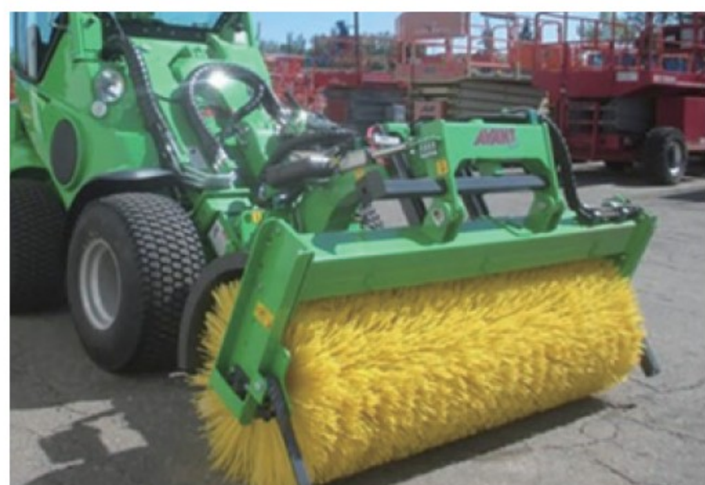
アバント用 ロータリーブラシ ■1.5m ■径550mm ■200kg デモ機 ¥946,000