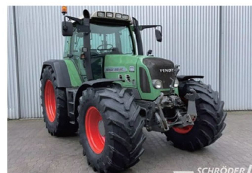
フェント 818 TMS ■180馬力 ■2006年 ■15,950時間 ¥13,090,000