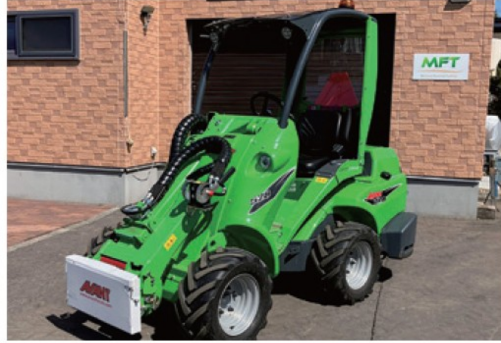
アバント 528R ■26馬力 ■揚力 950kg ■2024年 ■100時間 ¥6,820,000