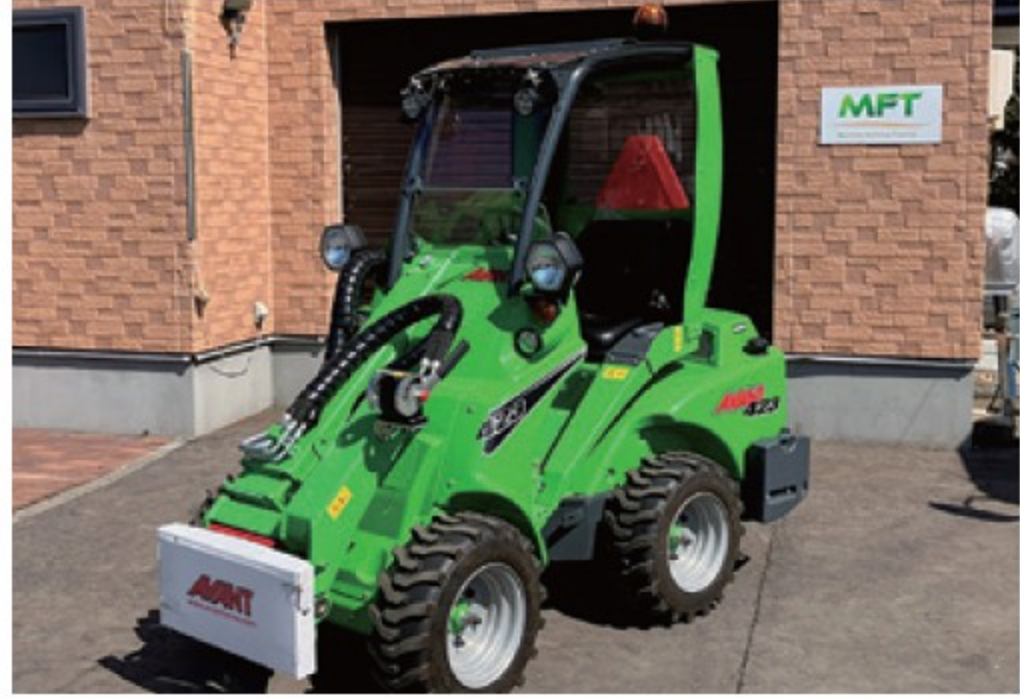
アバント 423L ■22馬力 ■揚力 550kg ■2024年 ■50時間 ¥4,620,000