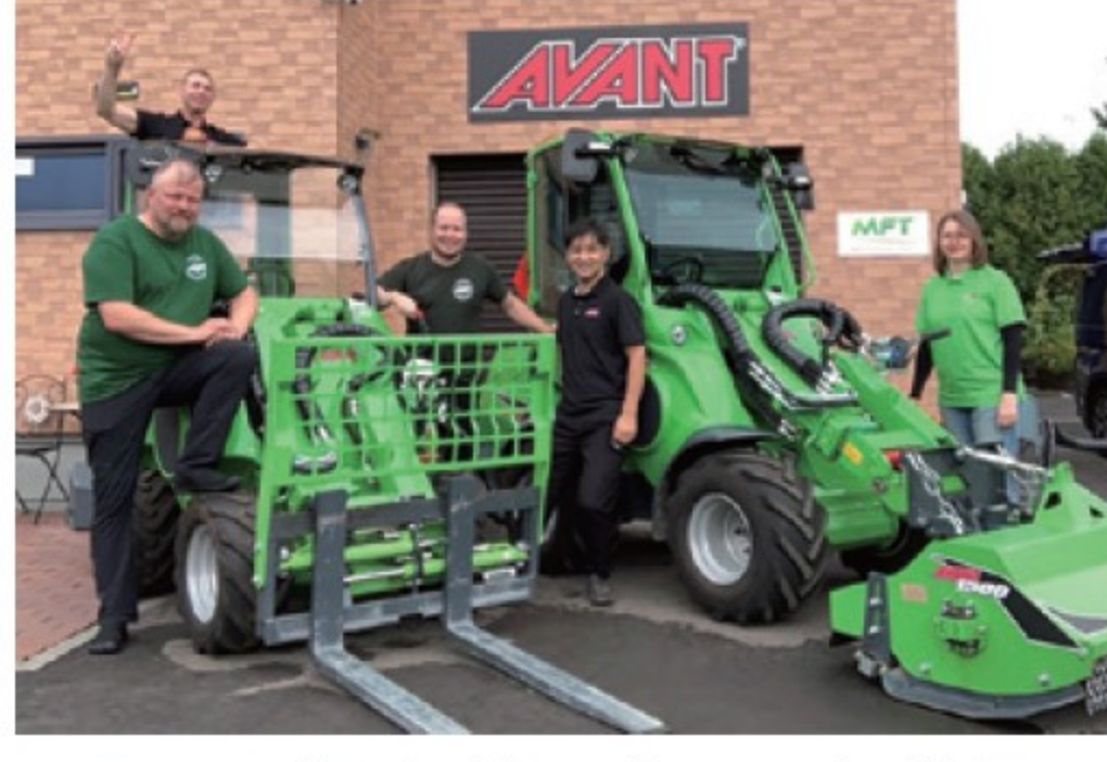
■ アバント社スタッフと共に