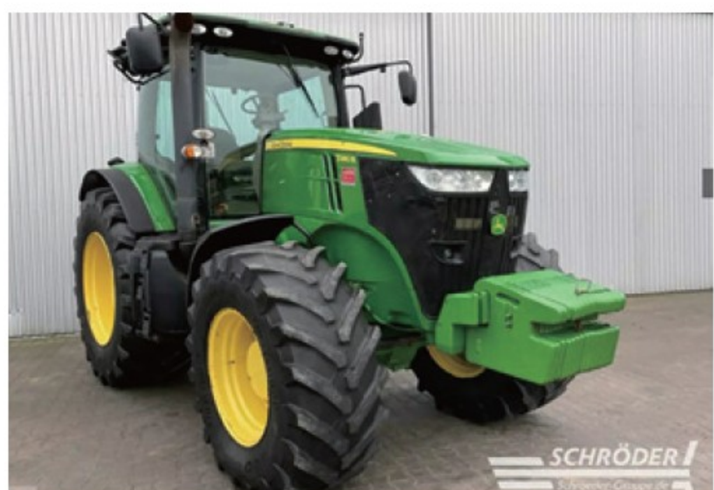
JD 7280R ■280馬力 ■2012年 ■5,980時間 ¥15,400,000