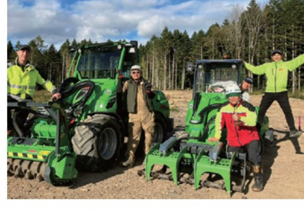
■ 林業デモ会 in 当別